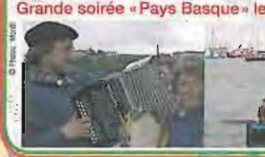
Grande soirée « Pays Basque » le j

Le projet est porté par la dynamique Associ Pasaia, près de San Sebastian. La flottille : une vingtaine de ba emblématiques de la grande tradition marin Le village (Port de Vannes rive droite) Un chantier naval et ses charpentiers de ma L'exposition « Les pêcheurs Basques au C sur la chasse à la baleine, la pêche à la fourrure avec les amérindiens. La grande expo inédite « Les Bateaux c L'espace d'animations « La morue de la (démonstrations de débarquement à qua traditionnelles, artisans en costume d'épo La musique traditionnelle basque (group Le resto-bistrot avec toutes les spécialité